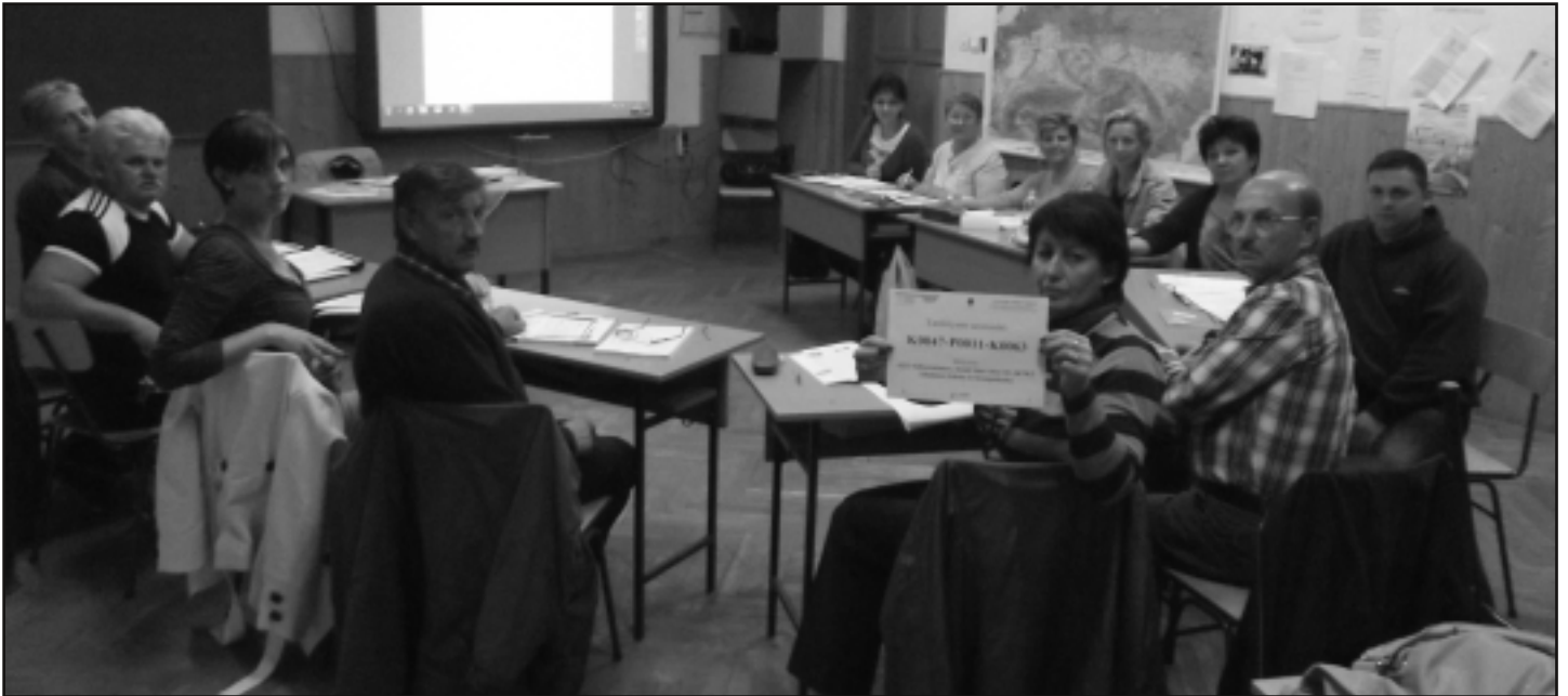
Fent a német, lent az angol csoport tagjai.