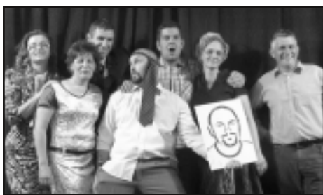
Az alkohol öl című darabot színre vivő társaság az előadás után.