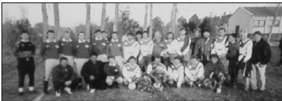
Egy korabeli fotó: 1995 őszén a Stadler FC volt a soltszentimrei csapat vendége.