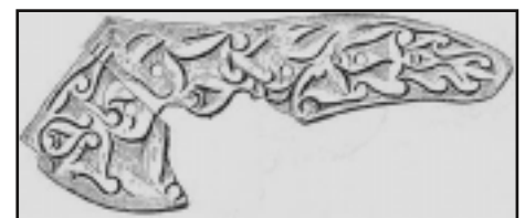
A Blaskovich birtokon talált honfoglaláskori nyereg csontdísze a Borovszky féle monográfiából.