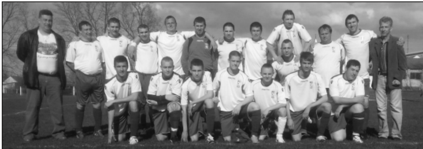
A 2012/2013 idényben, a bajnoki pontokért versenyző soltszentimrei csapat.