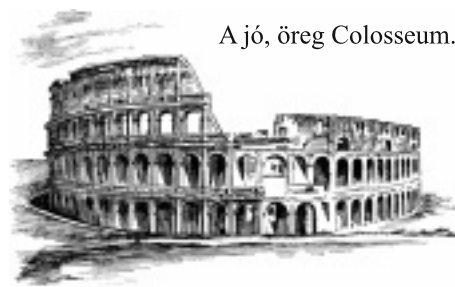
A jó, öreg Colosseum.

Kenyeret és cirkuszt. Milyen jól is hangzik. Etetni a népet, s közben ingyen szórakozást biztosítani neki. Aki látta a Colosseumot, annak monumentalitását, a sok ezer férőhelyes hatalmas építményt, az tudja, mire gondolok. S ehhez nem is kell Rómába utazni, elég egy fénykép hozzá. Az is a fenti értékeket, vagy értéktelenségeket szolgálta.