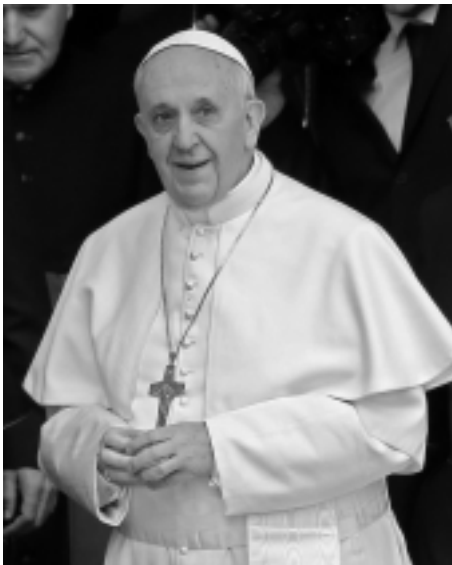
Ferenc pápa, Jézus Krisztus új helytartója.