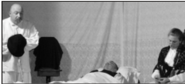
A tabdi Csepürágó Színjátszókör.