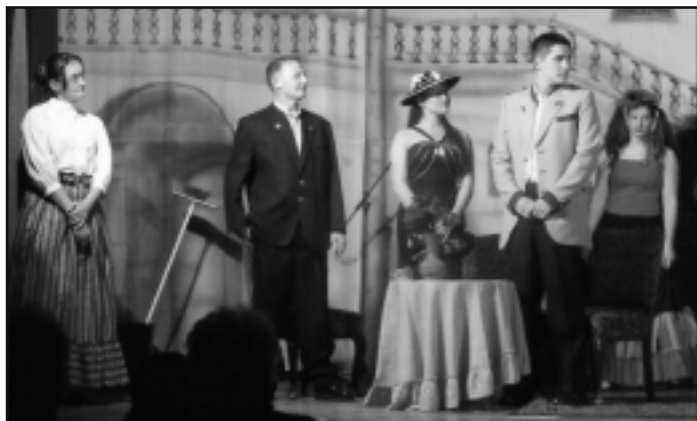
A Tabdi Felnőtt Színjátszók.