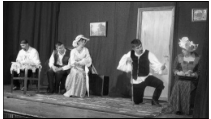
A helyi Csonka Színkör.