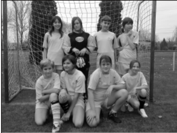
A lánycsapat tagjai: